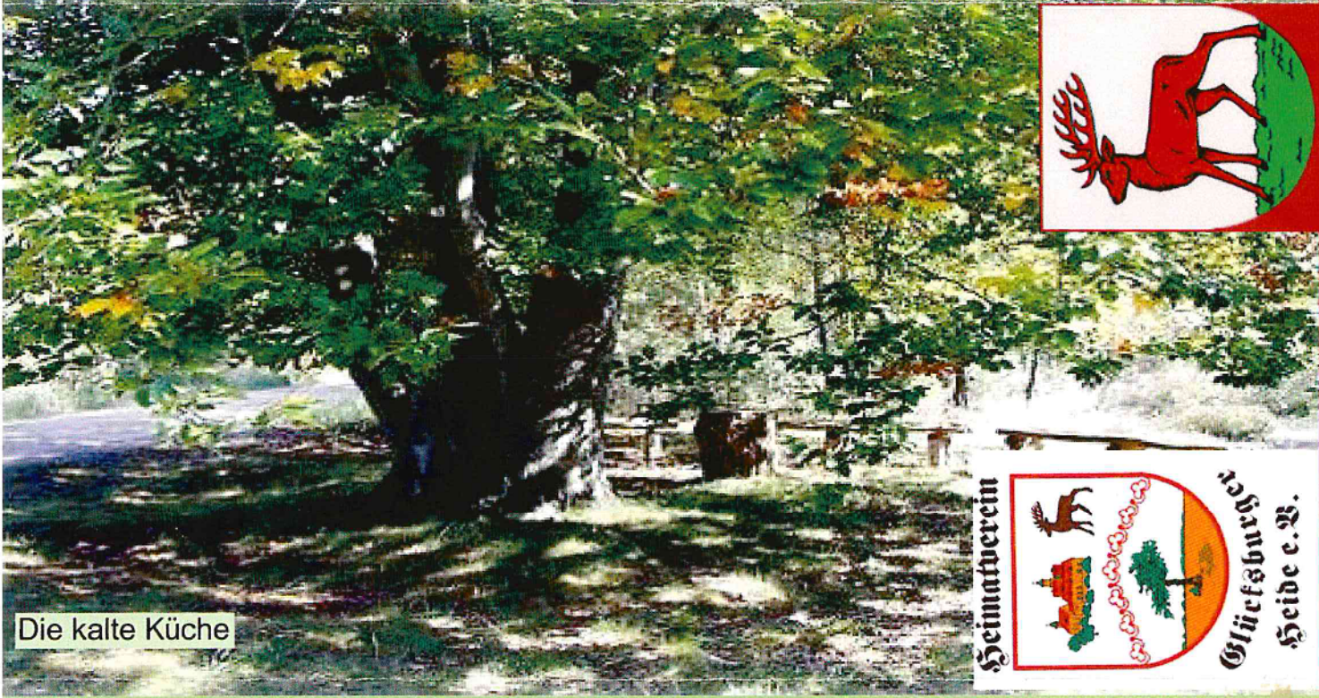
Die kalte Küche